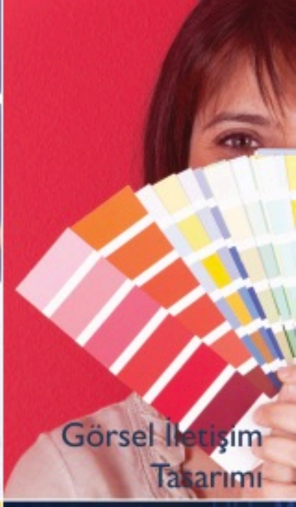
Görsel İletişim Tasarımı