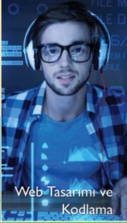
Web Tasarımı ve Kodlama