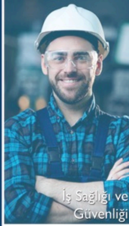
İş Sağlığı ve Güvenliği